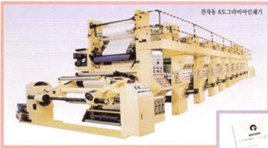
전자동 8도 그라비아인쇄기